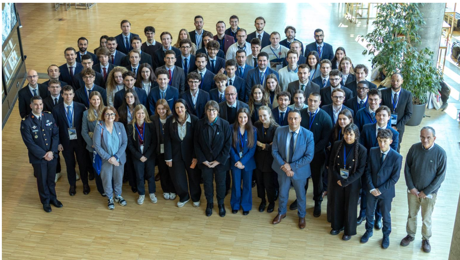
Photo de groupe du 161 e Cycle Jeunes de l'IHEDN à GEM

Face à l'intérêt croissant des étudiants pour les enjeux de défense, de souveraineté et de géopolitique, GEM travaille d'ores et déjà, aux côtés de ses partenaires, à la prochaine édition du Cycle Jeunes IHEDN. L'École entend également renforcer et développer des initiatives pédagogiques sur ces thématiques, en réponse à une demande en forte progression et à l'évolution des enjeux contemporains.