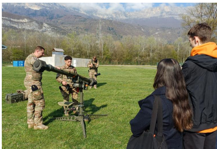
Visite de la 27 e BIM à Varcès

Pour sa 16 1 e édition, 72 étudiants et jeunes actifs venus de toute la France ont vécu une semaine d'immersion structurée autour de trois modules clés : enjeux stratégiques, connaissance des outils de défense et des Armées, et conflits et coopération internationale . Au programme : conférences, ateliers pratiques, études de cas et visites de SMOC Industries et de l'État-Major de la 27 e BIM (Brigade d'Infanterie de Montagne, également partenaire de GEM). Les participants ont également échangé directement avec des intervenants de haut niveau, parmi lesquels la Sous-Préfète Élisabeth Castellotti, l'Amiral Anne Cullerre, ainsi que les Généraux Philippe Gimbert, Laurent Michon et Laurent Bitouzet . Ces échanges, complétés par des travaux en groupe, leur ont permis d'appréhender concrètement les enjeux stratégiques et de développer des compétences directement mobilisables dans leur futur parcours professionnel . À l'issue de la semaine, une restitution des travaux a été présentée dans les locaux de la Préfecture de l'Isère.